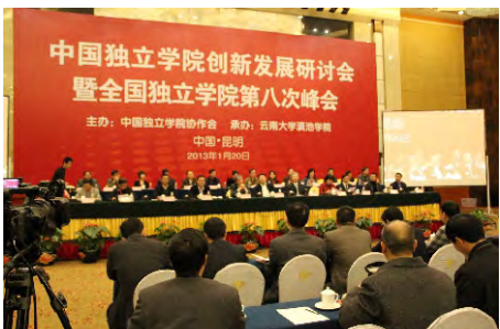
本报讯 1月20日，由中国独立学院协会主办的“中国独立学院创新发展研讨会

暨全国独立学院第八次峰会”在昆明召开。来自全国200多所独立学院的负责人和专家、学者400余人出席大会，交流办学经验。